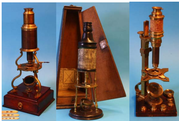
Foto van links naar rechts: Culpeper-type microscoop gesigeneerd door G.Adams, originele Culpeper, met handelsmerk in de kist, gesigeneerde Cuff microscoop.

Om de 'Ploem-collectie' een goede plaats binnen de stichting te geven, worden alle microscopen geïndexeerd, gefotografeerd en beschreven waarna ze worden toegevoegd aan de collectie op de website. Daarnaast zijn er vitrinekasten besteld waarin de microscopen mooi tot hun recht zullen komen.